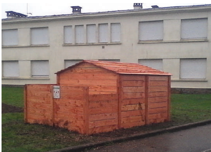
Pavillon de compostage implanté en décembre 2015

Les restaurants scolaires des écoles Françoise Bossier et Coat Pin montrent l'exemple car ils sont équipés de composteurs pour valoriser les biodéchets issus de la préparation des repas et des restes d'assiette des enfants.